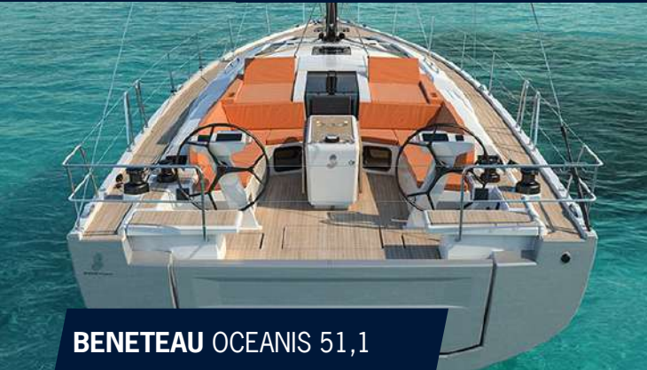
BENETEAU OCEANIS 51,1