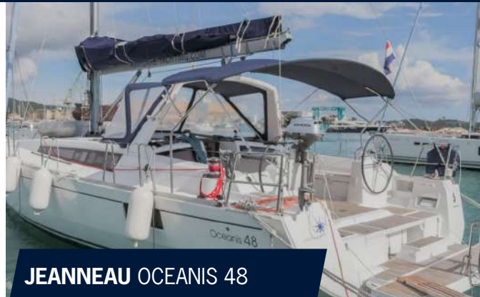
JEANNEAU OCEANIS 48