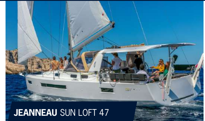
JEANNEAU SUN LOFT 47