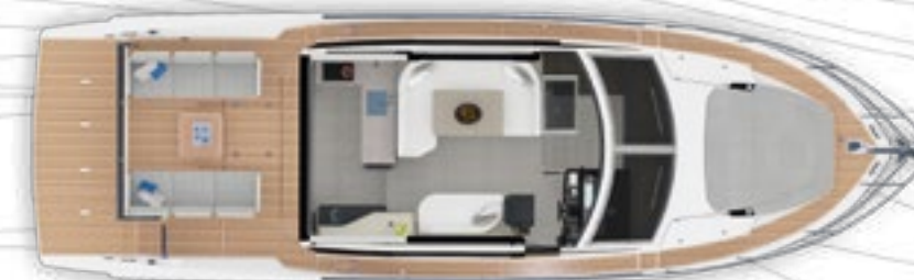
MAIN DECK | PONTE PRINCIPALE