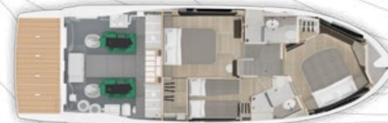
LOWER DECK | PONTE INFERIORE

To continually improve its models, Absolute reserves the discretion to produce on its own boats all the suitable variations, also in waiver of the specifications contained in catalogues, price lists, technical files, internet websites, advertising, newspaper articles and in every other publication, without any prior notice: even if Absolute tries, its best to update the informative documentation, every type of quoted publication can not be considered a certain and updated source of the current executive specifications. Absolute boats are offered to the world market and for this reason they can be equipped with standard and optional equipment, different from Country to Country.