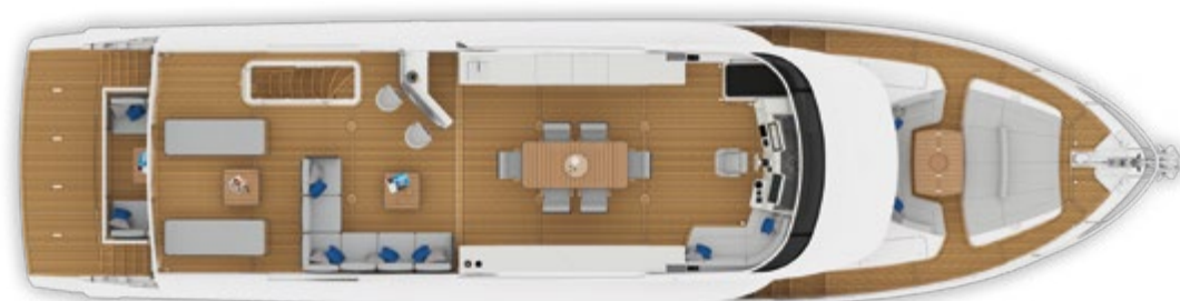
UPPER DECK | PONTE SUPERIORE