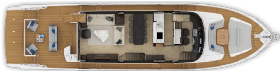
MAIN DECK | PONTE PRINCIPALE